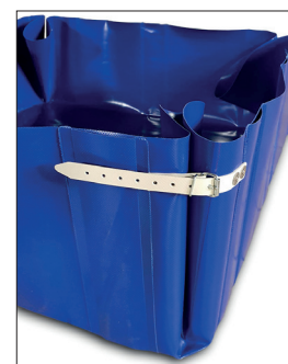
Bac souple avec soufflet